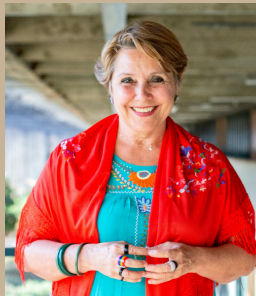
Deputada Federal Erika Kokay (PT-DF)

A Deputada Federal Erika Kokay (PT-DF), também exerceu um importante trabalho e esteve presente na votação do PL: “Grande vitória! Lutar sempre vale à pena!”, comentou.