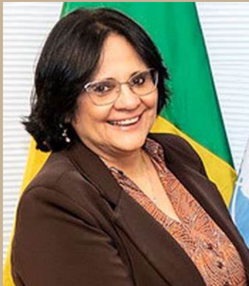
Senadora Damares Alves (Republicanos-DF)

A Senadora Damares Alves (Republicanos-DF), que também fez parte da jornada, comemorou: “Nossos policiais precisam ser justificados. É uma luta antiga. São meses lutando por isso”.