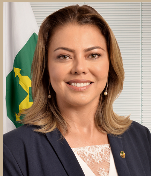
Senadora Leila Barros (PDT-DF)

A Senadora Leila Barros (PDT-DF) teve uma atuação bem importante nessa luta. “Nosso trabalho é defender os interesses do Distrito Federal, os três senadores têm trabalhado em equipe, e isso tem surtido um efeito muito positivo. É um exemplo de civilidade, independente dos campos de atuação”, afirmou Leila.