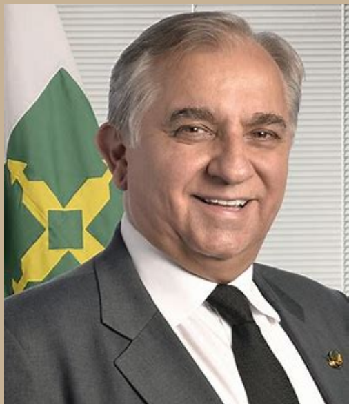
Senador Izalci Lucas (PSDB-DF)

Entre eles, o Senador Weverton Rocha (PDT-MA), o Deputado Federal Gilvan Máximo (Republicanos-DF), a Deputada Dra. Jane (MDB/DF), o Deputado Reginaldo Veras (PV/DF), o Chico vigilante (Deputado Distrital PT/DF), além do Senador Izalci Lucas (PSDB-DF).